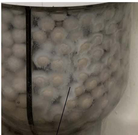
Figure 1: Salt precipitate deposited on neutralization media from Aluminum heat exchangers