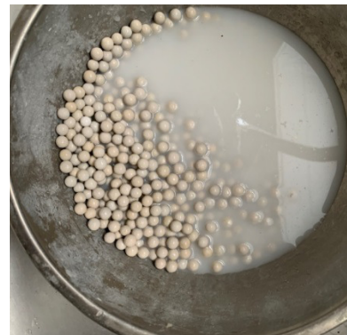
Figure 2 - Média neutralisant après rinçage à l'eau claire

L'installation de raccords unions est recommandée pour faciliter le déplacement du bac au moment de remplacer le média neutralisant.