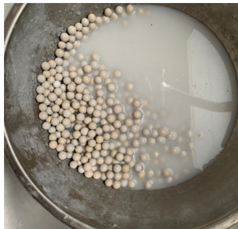
Figure 2: Neutralization media that has been rinsed with clean water