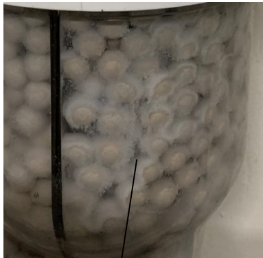
Figure 1 - Précipité de sel déposé sur le média neutralisant des échangeurs de chaleur en

- Les chaudières à échangeur de chaleur en aluminium causent un dépôt de sel blanc sur le média de neutralisation, ce qui restreint le débit au travers du média. Pour nettoyer le média, retirez le couvercle, puis rincez soigneusement le média à l'eau.